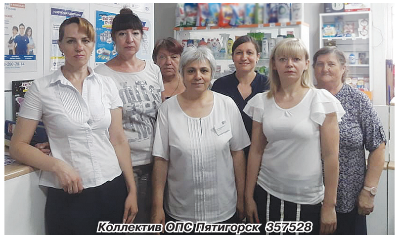
Коллектив ОПС Пятигорск 357528

Поздравляем вас, уважаемые сотрудники почты, с профессиональным праздником! Пусть работа приносит вам удовольствие. Желаем счастья и здоровья вам и вашим семьям!