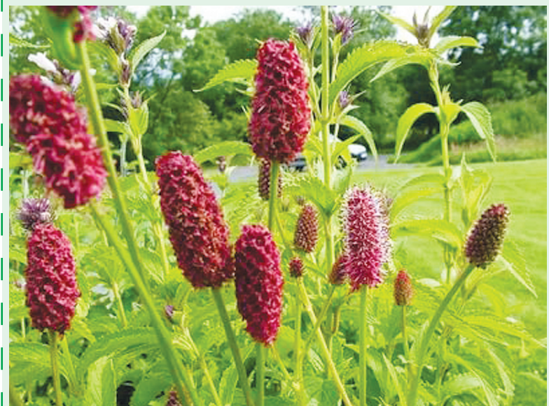
ПО ВОЗМОЖНЫМ ПРОТИВОПОКАЗАНИЯМ ПРОКОНСУЛЬТИРУЙТЕСЬ С ВРАЧОМ