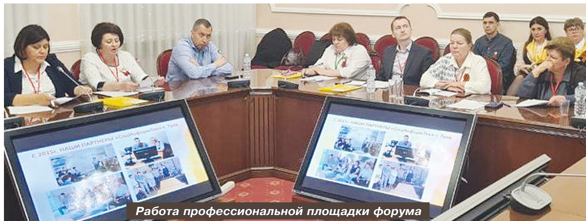
Работа профессиональной площадки форума

Делегация «Предгорного комплексного центра социального обслуживания населения» приняла активное участие в Северо-Кавказском межрегиональном форуме «Забота о старшем поколении – государственный приоритет», который состоялся 27-28 апреля в г. Ставрополе.