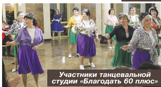
Участники танцевальной студии «Благодать 60 плюс»

и четвёртый год реализует эту новаторскую систему во всех формах социального обслуживания на территории округа.