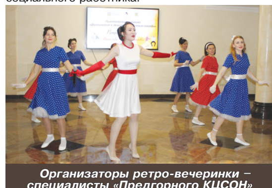
Организаторы ретро-вечеринки – специалисты «Предгорного КЦСОН»