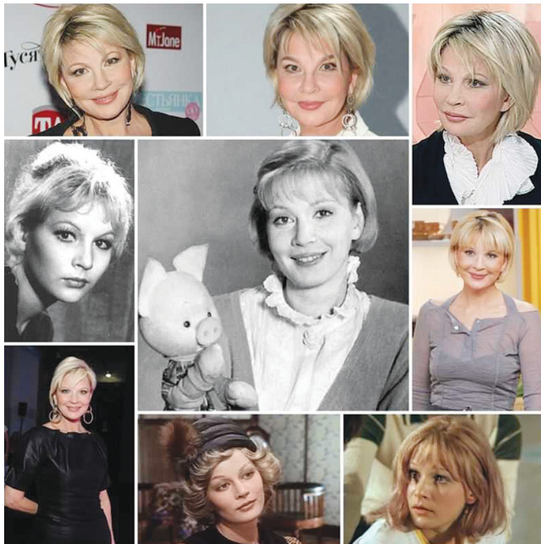
Татьяна Вениаминовна Веденева – советская и российская актриса театра и кино, телеведущая, журналистка. Заслуженная артистка Российской Федерации.

«Мы в «Спокойной ночи, малыши!» старались привить ребятам правильные ценности. Каждая история учила чему-то хорошему. Для меня Хрюша и Степашка были уже как живые».